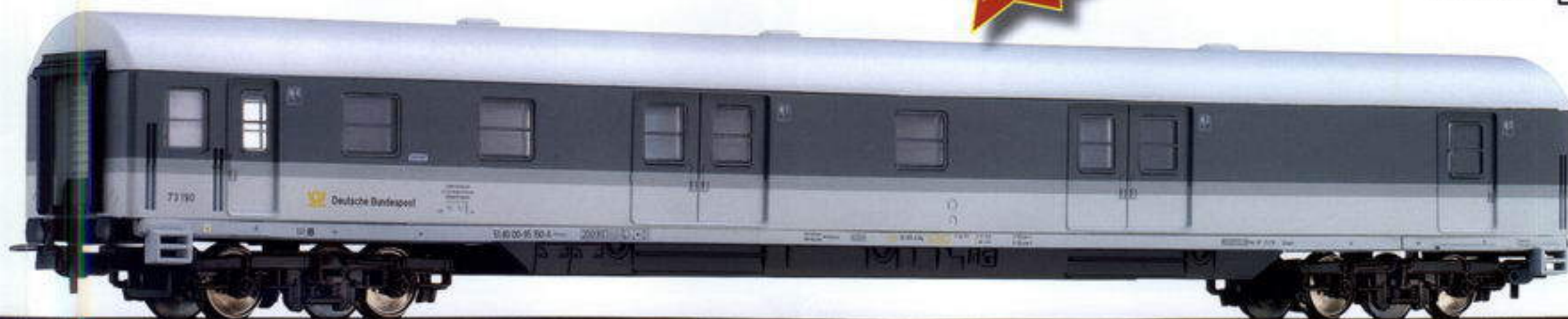
74711 Bahnpostwagen der Deutschen Bundespost Mail waggon of the german post, limited edition