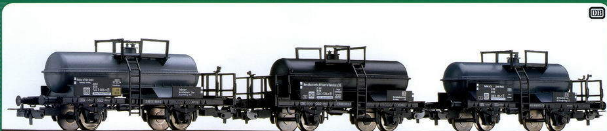
74176 Kesselwagen-Set, bestehend aus 3 Säurekesselwagen Tank waggon set, consisted of three acid tank waggons